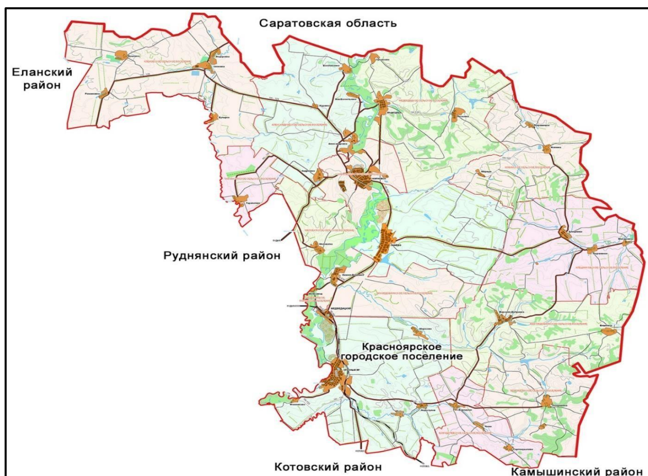
Рисунок 1.1.1 – Размещение Красноярского городского поселения Жирновского муниципального района

Общая площадь территории Красноярского городского поселения составляет 36 711 га.