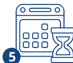
5 Патент алуу