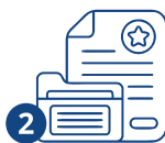
2 Документтерди даярдоо