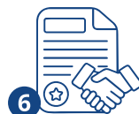
6 Жумушка алуу