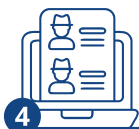
4 Документтерди тапшыруу