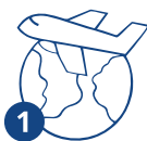
1 Россияга келүү

Ишке патенттин мөөнөтү 12 айга чейин чектелген. Төлөм патент жарактуу болгон ар бир ай үчүн жүргүзүлөт. Эгер патентти убагында төлөбөсөңүз – ал күчүн жоготот!